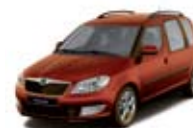
Tangerine Orange - M2