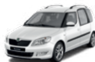
Candy White uni - 9P