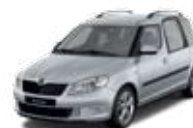
Brilliant Silver metallic - 8E