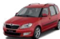
Corrida Red uni - 8T